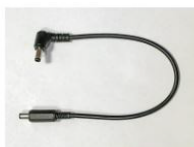
USB-Cアダプタ用ケーブル